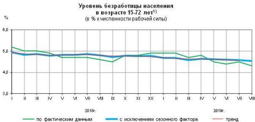
Рис. 2. Динамика изменения уровня безработицы в России в 2018-2019 гг.

Уровень безработицы измеряется в процентах безработных (по данным выборочных обследований населения по проблемам занятости) к количеству экономически активного населения 14 . В России разброс уровней безработицы в региональном разрезе достаточно велик 15 . На рис. 2 приводится динамика уровня безработицы в России в 2018-2019 гг.