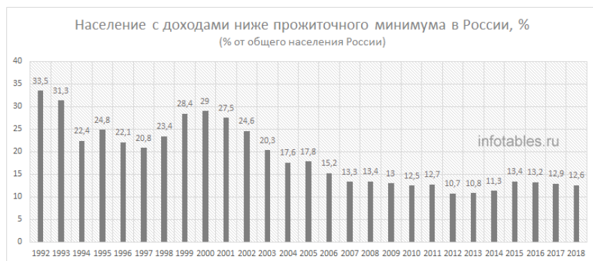
Рис. 3. Динамика изменения показателя - доля населения с денежными доходами ниже величины прожиточного минимума в 1992-2018 гг. [7]

Численность населения с денежными доходами ниже величины прожиточного минимума определяется на основе данных о распределении населения по величине среднедушевых денежных доходов и является результатом их соизмерения с величиной прожиточного минимума (рис. 3).