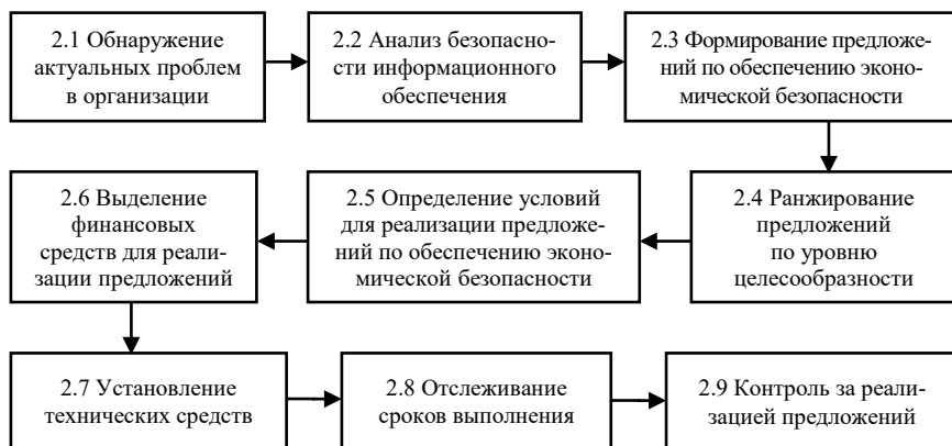
Рис. 2. Технология развития процесса управления экономической безопасностью организации: проведение (фрагмент 2)

Развитие процесса управления экономической безопасностью функционирования организации должна быть подвержена постоянной оценке, т.е. мониторингу изменения факторов экономического риска и угроз деятельности. Это должно отслеживаться с целью оценки экономического состояния организации и его соответствия внешней среде в зависимости от сложившейся ситуации для обеспечения устойчивого развития организации.